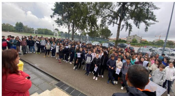
“Crescer Brincando” Na Escola José Saraiva – Leiria

Dinamização pelo 4º ano consecutivo do Projeto Crescer Brincando através de apoio técnico às várias escolas da cidade e realização de 4 atividades no Regimento de Artilharia 4, Parque da Almuinha Grande, Escola José Saraiva e Escola Correia Mateus.