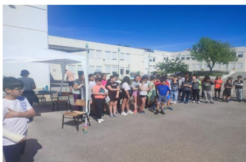
“Crescer Brincando” Na Escola Correia Mateus – Leiria