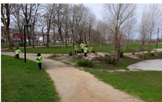
“Crescer Brincando” No Jardim Da Almuinha Grande – Leiria